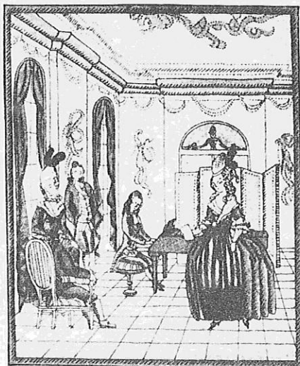
Eines hatte den Flügel geöffnet . . .