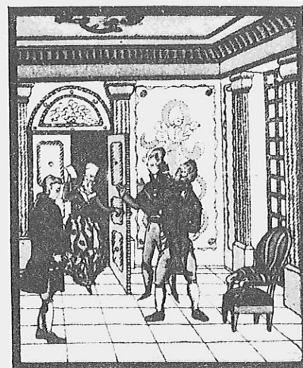
„Wißt ihr“, rief sie, „wer unten ist?“