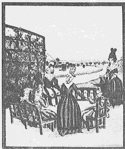
. . . Von wo man das offene Feld, auf das Dorf und die Landstraße sah . . .